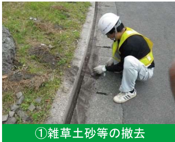
①雑草土砂等の撤去