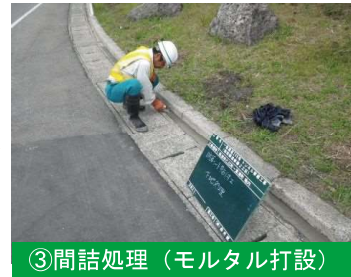
③間詰処理（モルタル打設）