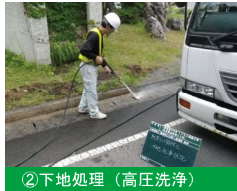
②下地処理（高圧洗浄）