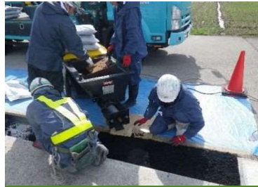
⑤ブチルゴム合材敷設