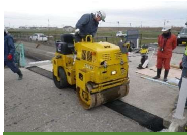
⑧表層敷設・仕上げ