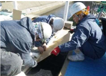
④ラッピングシート貼付(下層)