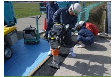
⑥ブチルゴム合材転圧