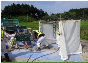
①既設伸縮装置撤去