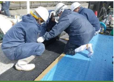
⑦ラッピングシート貼付(上層)