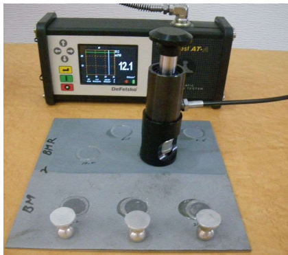
自動プルオフ式付着試験機